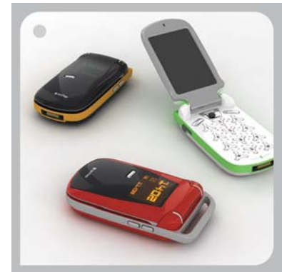
Рис. 2. Мобильный телефон VIXA на базе инновационной технологии ввода текстовой информации UNITAP