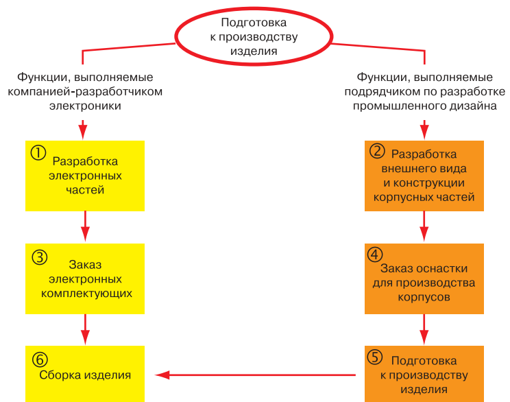
Рис. 11. Схема подготовки производства электронного прибора

выполняются проекты, направленные на создание электронных устройств. На этих же, относительно ранних этапах разработки дизайна будущего изделия подключается ряд других специалистов, в частности инженер-технолог компании «СмирновТехнологии», в обязанности которого входит проектирование пресс-формы корпуса с индивидуальным дизайном. Учитывая сложность электронных устройств и их многофункциональность, к работе над проектом могут привлекаться специалисты и из других областей (см. рис.10).