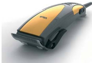
Рис. 6. Машинка для стрижки волос VITEK

Кроме того, дизайн и конструкция серии приборов для проведения лабораторных занятий на уроках физики и химии, разработанные усилиями дизайнеров и специалистов компании «СмирновДизайн», были отобраны Министерством Образования РФ в качестве базовых при оснащении школ России. Уже с 2004 г. эта серия, одоб-