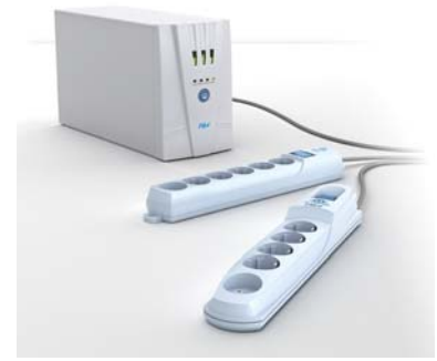
Рис. 1. Стабилизатор напряжения Pilot eLR и сетевые фильтры Pilot GL и Pilot S

— промышленный дизайн автотелефоники — маршрутные компью-