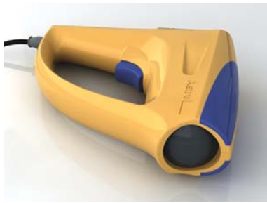
Рис. 5. Стробоскоп Multitronics Astro

теры и стробоскопы для Multitronics (см. рис. 5);