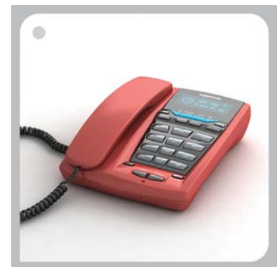
Рис. 4. Телефон «Байкал» для компании GOODWIN