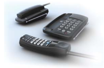
Рис. 3. Серия радиотелефонов ESPO TS-9100, 9101, 9102