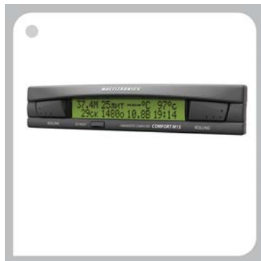
Рис. 8. Маршрутный компьютер для 8-го и 9-го семейств автомобилей ВАЗ Comfort M15

Также из недавних проектов можно отметить работу над дизайном автомагнитол AKAI, когда перед специалистами компании была поставлена сложная, с маркетинговой точки зрения, задача создания изделий для мирового бренда с долгой историей существования на рынке (см. рис. 9).